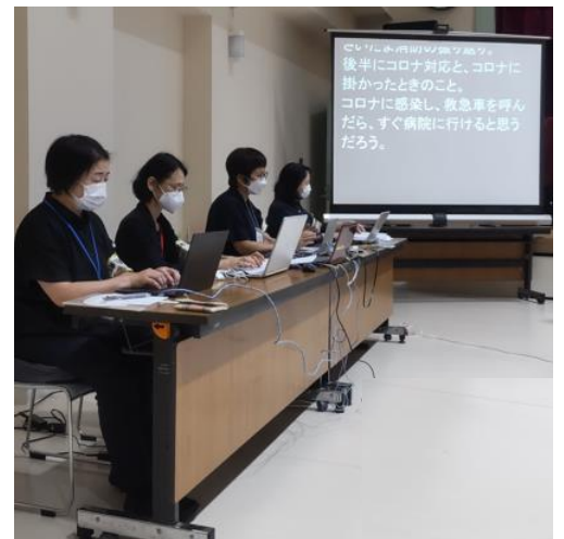
パソコン要約筆記