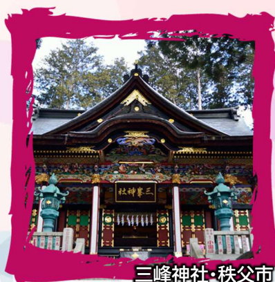
三峰神社・秩父市