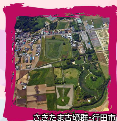
さきたま古墳群・行田市