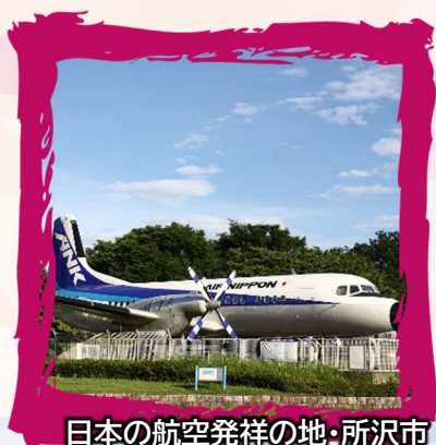
日本の航空発祥の地・所沢市