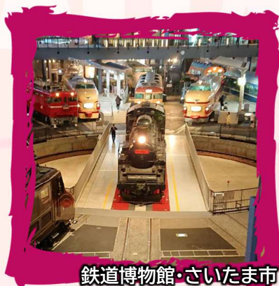
鉄道博物館・さいたま市