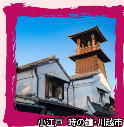
小江戸 時の鐘・川越市