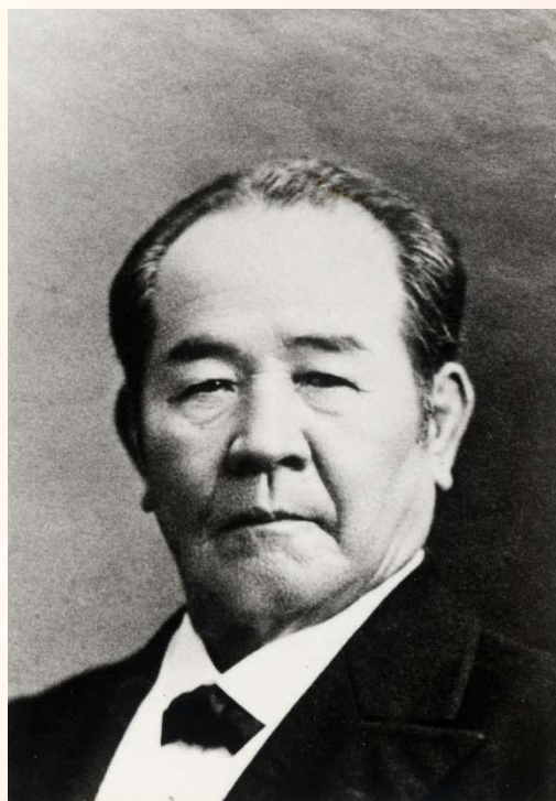
埼玉県深谷市所蔵