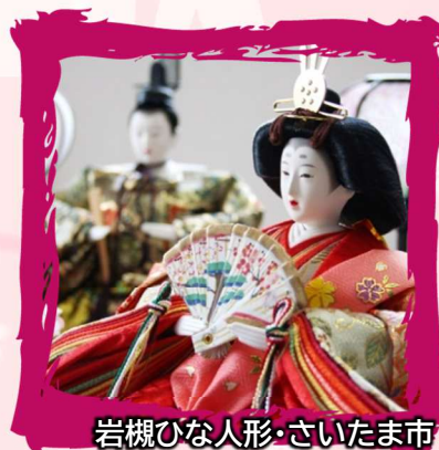
岩槻ひな人形・さいたま市