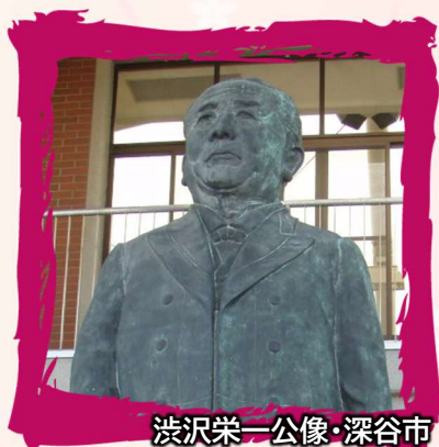
渋沢栄一公像・深谷市