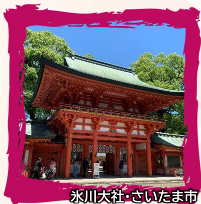
氷川大社・さいたま市