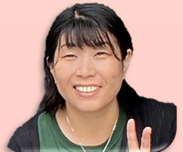
医療プロジェクト