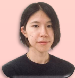
ふれあいの里・どんぐり