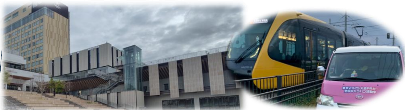
ライトキューブ宇都宮